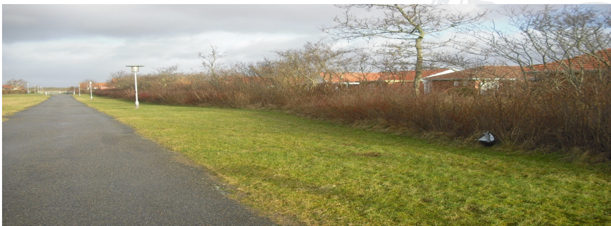
Figur 2 Foto af eksisterende plantebælte benævnt "krat" og beliggende inden for fælles friareal

Af ansøgningen fremgår det, at beplantningen på arealet vokser vildt og ikke vedligeholdt, se figur 2, hvilket er begrundelsen for de 4 grundejeres ønske om køb af arealet, og tillægge det deres nuværende grundstykke, se figur 3.