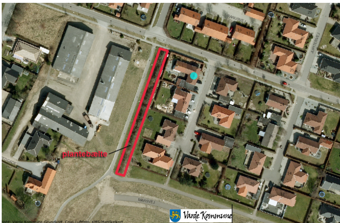
Figur 1 Luftfoto der viser det ansøgte areal der støder op til haverne til ejendommene Jupitervej 8-12

Fire grundejere i boligområdet ved Jupitervej ansøgte i 2011 om hver især at købe et areal bestående af et plantebælte mellem en sti og deres ejendom, se figur 1. Det ansøgte areal er omfattet af Lokalplan 101 Alslev Nord.